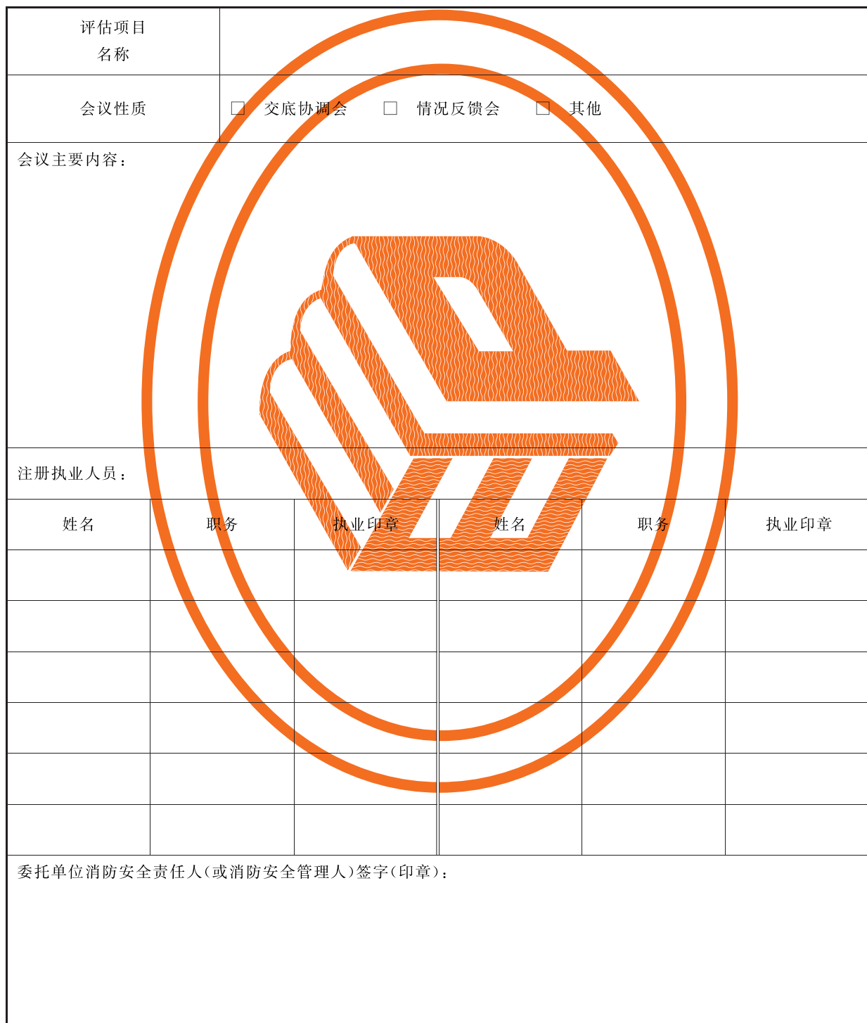
表 B.1 单位消防安全评估会议注册执业人员签到表示例