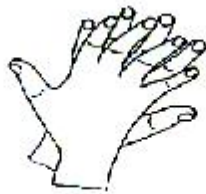
2. 手指交错掌心对手背搓擦