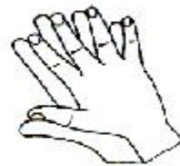
3. 手指交错掌心对掌心搓擦