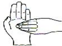
6. 指尖在掌心中搓擦